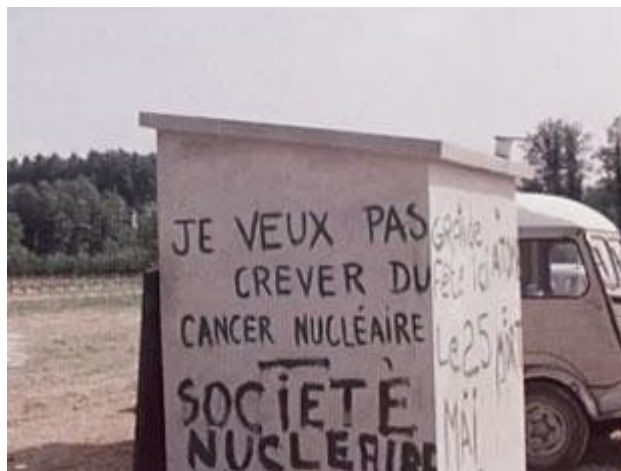
i5 – Région de Creys-Malville, 1977

C'est en ce sens que la contribution de la sociologie à la construction d'un recueil de mémoire initie la construction d'un espace de mise en travail, partagé autour de l'engagement pour la PNE.