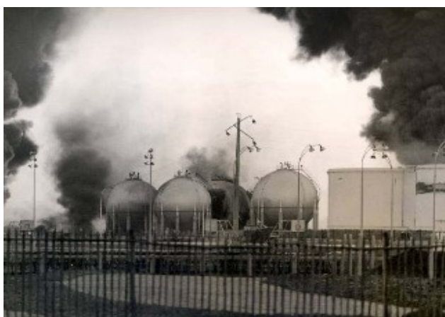
i1 - Incendie de la raffinerie de Feyzin, janvier 1966

Apparues localement à la suite de divers événements (catastrophes industrielles et écologiques, projets d'aménagement, etc...), les préoccupations environnementales ont d'abord été relayées par des associations et des collectifs – souvent informels – réunis autour de la protection et la défense de l'environnement. Ces associations étaient alors naissantes dans les années 1960, et la