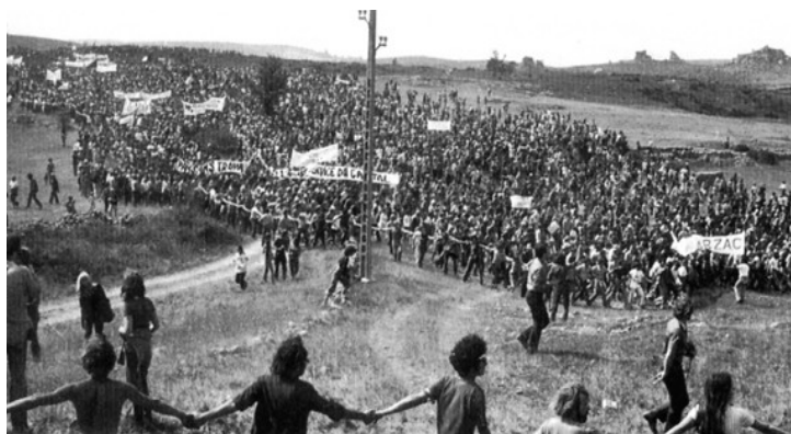
i3 – Manifestation sur le plateau du Larzac, 1972

Popularisé par son traitement politique, mais également médiatique, l'engagement public pour la PNE acquiert une telle importance au cours des années 1970 que nombreux sont ceux qui, aujourd'hui, considèrent cette décennie comme une période « charnière » pour la PNE. Marquées par l'importance des mouvements de contestation sociale, les « années 68 » s'érigent comme un concept réflexif, permettant d'appréhender une période marquée par la contestation politique et les mutations culturelles 2 . Il est cependant évident que les « années 68 » sont loin d'être une brèche temporelle homogène ; si nous soulignons ici leur conceptualisation, ce n'est pas tant pour décrire une période, que pour identifier des repères chronologiques permettant de